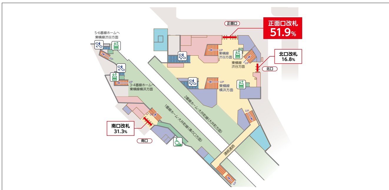
DATA : 東京急行電鉄調べ